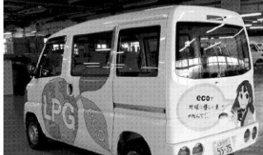
新デザインのLPガス車

伊丹産業が産学共同提案... 伊丹産業が産学共同提案で新しいLPガス車を開発した。