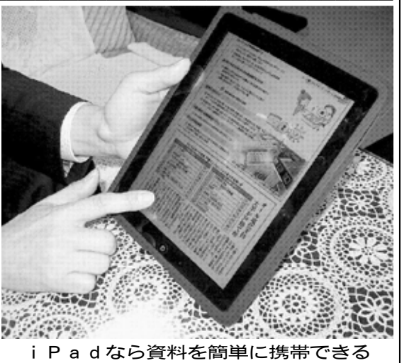
iPadなら資料を簡単に携帯できる