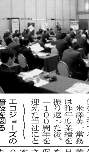
1店1基運動を推進する

大阪府LPガス協会(西本功会)は3月4日、大阪市の大阪府商工会館に73人を集めてエネファーム講習会を開いた。