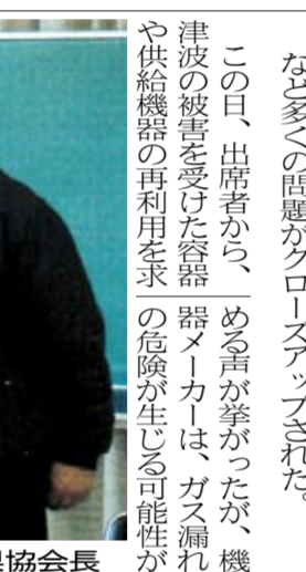
経済産業省は29日、この想定で有利に動くのがガス空調だ。電力不足が懸念されている。電力不足が懸念されている。

東京電力管内で今夏、最大1千万キロワットの電力供給不足が懸念されている。電力不足が懸念されている。電力不足が懸念されている。