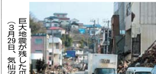
巨大地震が残した爪跡はまだまだ大きい(3月29日、気仙沼市)

宮城大震災緊急対策会議の3回目。3月28日、仙台市の県庁本庁舎で行われた。この日は、岩谷産業の系列の充填所を共同活用し、被災者の安全を確認した。SSに勤務する1人を除き、3日後までに全社員の安全を確認した。