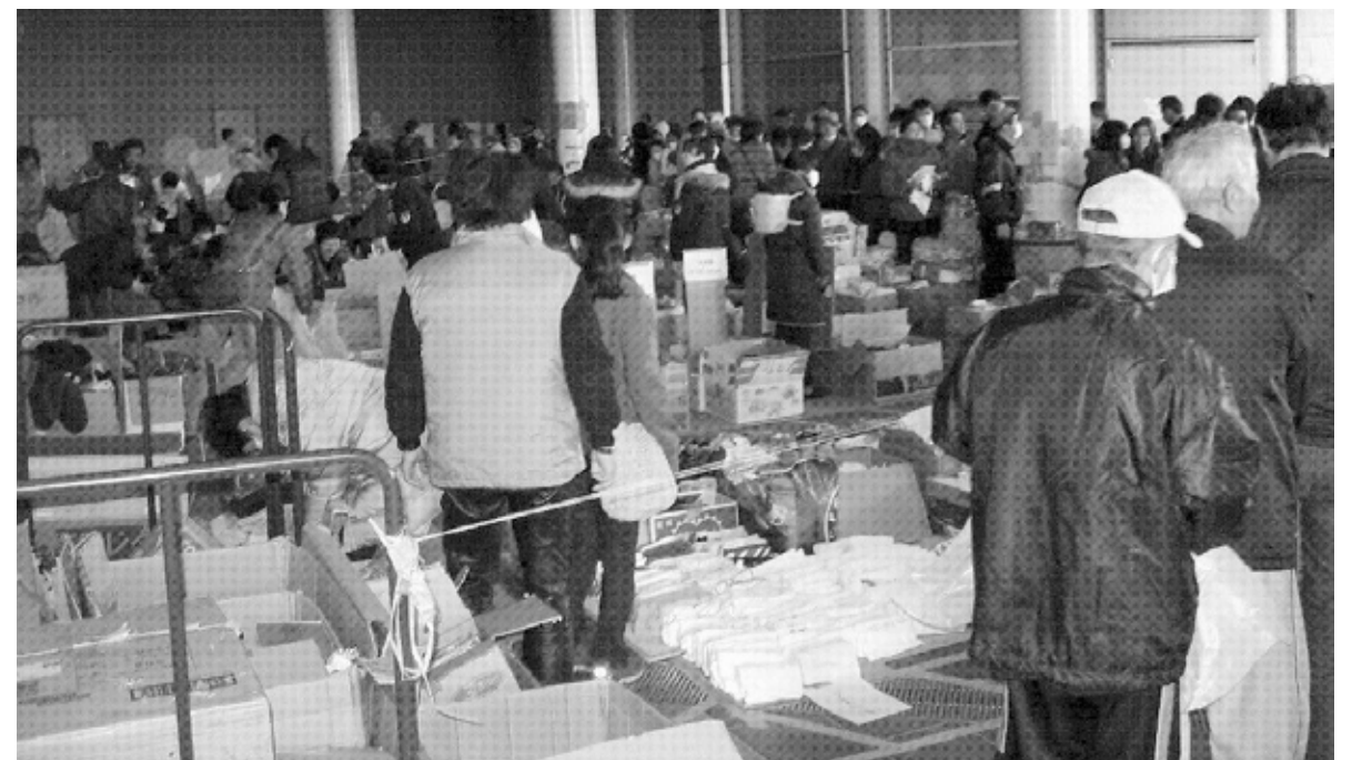
救援物資に並ぶ避難者ら(23日午前10時40分、さいたま市・さいたまスーパーアリーナ)