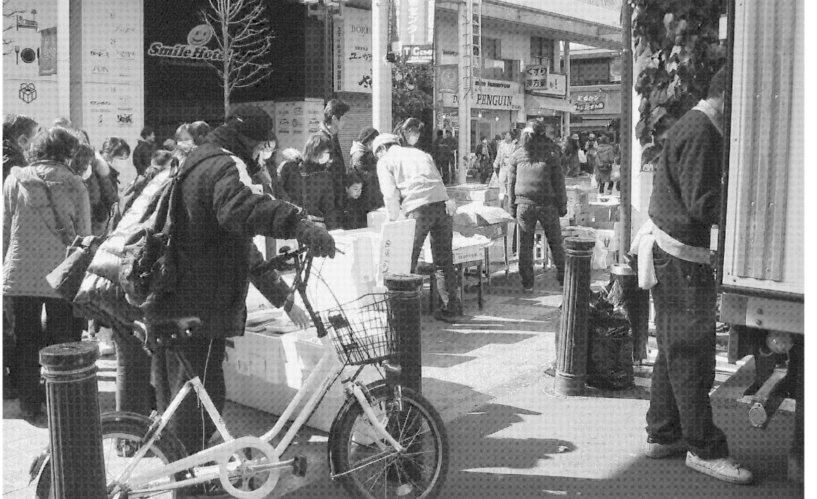
都市ガスが復旧していないため、店舗営業できない多くの飲食店が路上で弁当や総菜の販売を始めた(20日、仙台市青葉区)