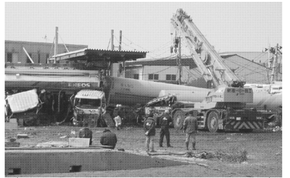
津波に流されて折り重なるタンクローリー(20日、多賀城市)