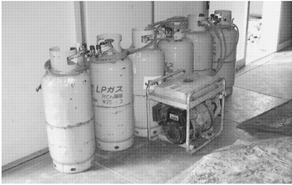
避難所に支援団体が運び込んだLPガス容器(18日、仙台市宮城野区高砂中学校)