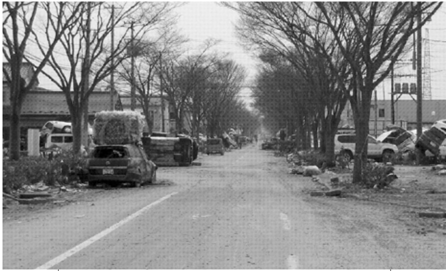
いまま大きなツメ跡が残る(20日、多賀城市)