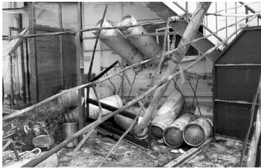
津波が押し寄せた事業所(20日、多賀城市)