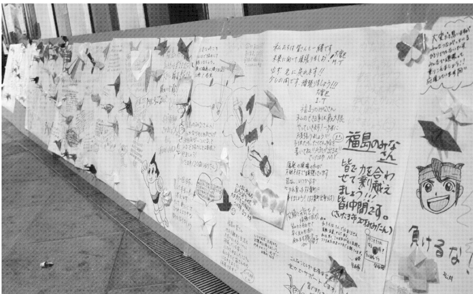
被災者らへの応援ボード(23日午後4時50分、さいたま市・さいたまスーパーアリーナ)