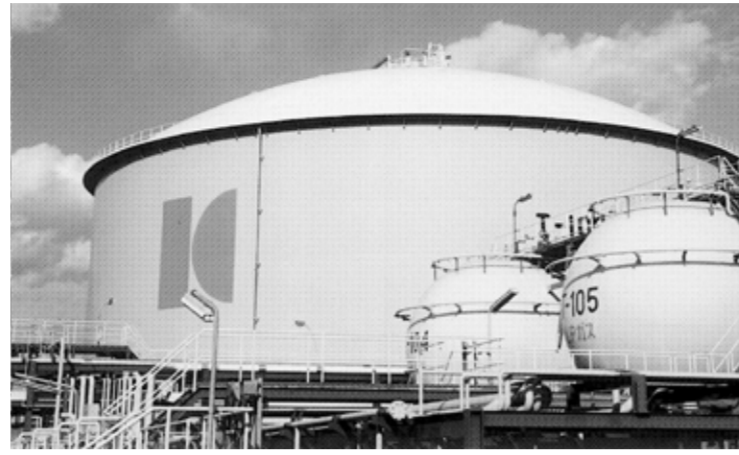
地震発生後に出荷停止した鹿島製油所。14日に再開したが、残高が損傷し輸出入船の着積はできない状況だ

資源エネルギー庁は15日、LPG民間備蓄の鹿島、千原の製油所、輸出入基地から申請したLPGの放出を承認し、輸出入基地に代わって、個別に対応して、橋をたたくような輸送を受け入れ、出荷する。また、日本LPG協会(古川雅英会長)は15日に開いた災害対策本部(本部長・古川雅英)で、LPGの供給が安定し、輸送が確保される見込みを報告した。同日、LPG協会は、LPGの供給が安定し、輸送が確保される見込みを報告した。同日、LPG協会は、LPGの供給が安定し、輸送が確保される見込みを報告した。