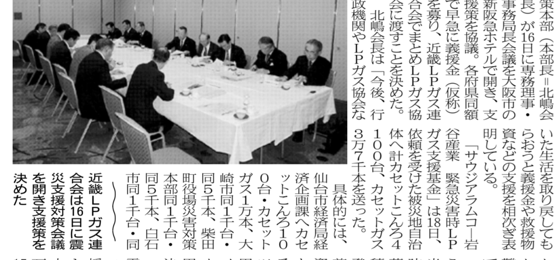
仮設住宅建設への動きが活発化している。被災地の復興に向けて、生活物資の供給が急務となっている。

被災地での復旧と支援をともに進めるための企業・団体の対応ドキュメント。被災地での復旧と支援をともに進めるための企業・団体の対応ドキュメント。被災地での復旧と支援をともに進めるための企業・団体の対応ドキュメント。