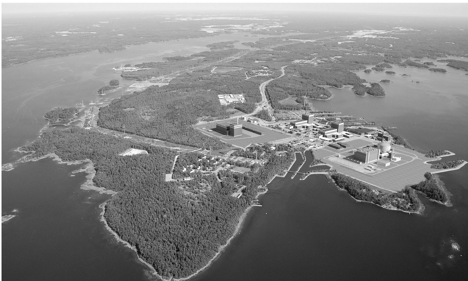
オリキルト (イメージ)