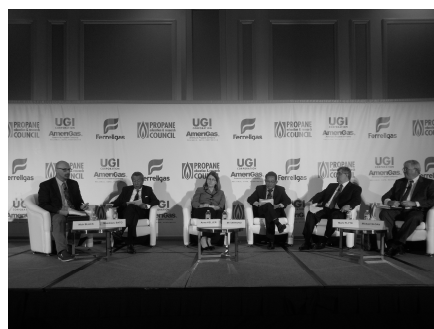
昨年のマイアミ大会では、佐藤雅一・EN EOS グローブ副社長 (左から 2 人目) がパネリストとして参加した

世界 L P G 協会 (=W L P G A、本部・パリ、キンボール・チェン理事長) が主催する L P ガス産業最大の国際イベント。マイアミ (米国) で開かれた前回大会には、世界 88 カ国の L P ガス関連企業・団体・政府機関等から約 2,000 人、日本からも過去最多となる 73 人が参加した。また、併催の技術展示会には日本企業 3 社を含む約 100 社が出展した。テーマ別会議では最新の業界トピックスや新技術、将来展望などが議論され、世界の業界人のビジネス交流の場となっている。技術展示会では、新製品・技術・システム等が出展され、商談の場として活況を呈している。