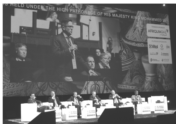
前回マラケシュ大会の会議セッション

世界LPG協会 (=WLPGA、本部・パリ、ペドロ・ジョルジ理事長) が主催するLPGガス産業最大の国際イベント。マラケシュ (モロッコ) で開かれた前回大会には、世界72カ国のLPGガス関連企業・団体・政府機関等から約1,500人が参加し、技術展示会には117社が出展した。テーマ別会議では最新の業界トピックスや新技術、将来展望などが議論され、世界の業界人のビジネス交流の場となっている。技術展示会では、新製品・技術・システム等が出展され、商談の場として活況を呈している。