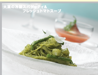
大葉の市販スパゲッティ&フレッシュマトースト 5-6月 イタリア料理