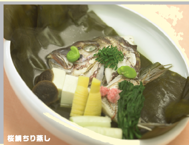
桜鯛ちり煮し 3-4月 日本料理