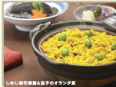
しめじ菊の花と茄子のオランダ煮 9-10月 日本料理