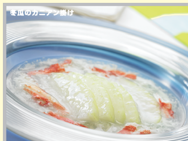
冬瓜のカニアン掛け 7-8月 中華料理