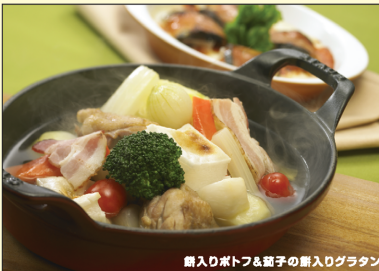
鍋入りポトフと茄子の鍋入りグラタン (表面)